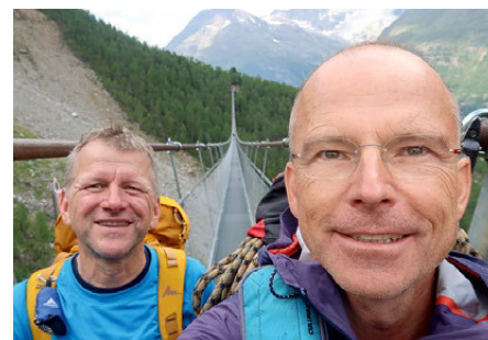
⬆️ Gebührender Abschluss der Tour: Die Charles-Kuonen-Hängebrücke

Fazit: wenn man wettermäßig gezwungen wird, die Akklimatisation zu minimieren, sollte man sich beim Aufstieg Zeit lassen und den Berg bewusst langsam angehen. Die Domhütte und ihr Team machen alles richtig, so dass auch eine reine Hüttentour dahin ein wahres Vergnügen ist! <<