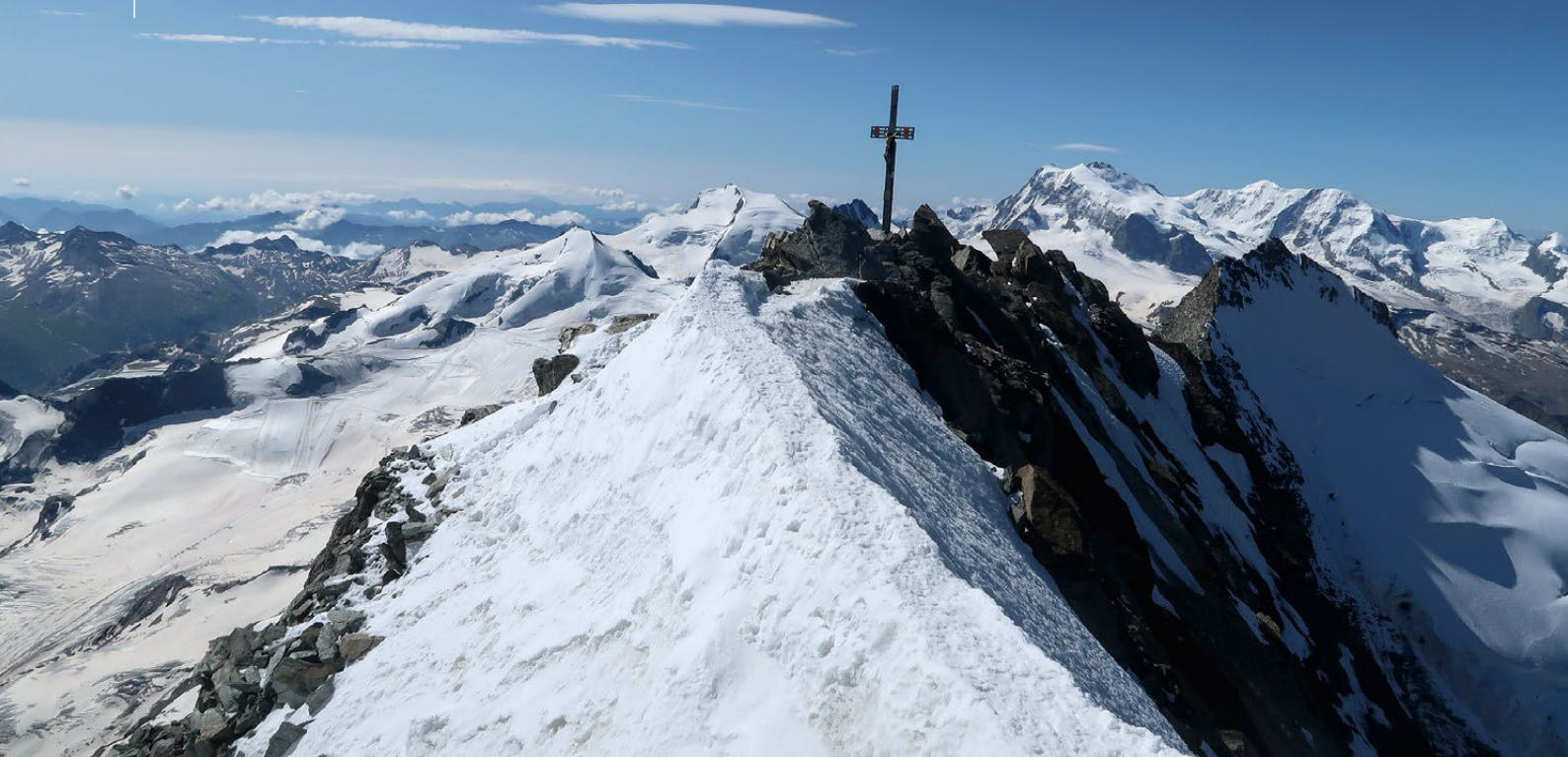
▲ Der Dom, im Hintergrund rechts das Monte-Rosa-Gebiet